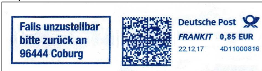
Bild 1: Text entspricht nicht exakt den Vorgaben.

Wurde bereits in früheren Jahren mit anderen Maschinen verwendet: